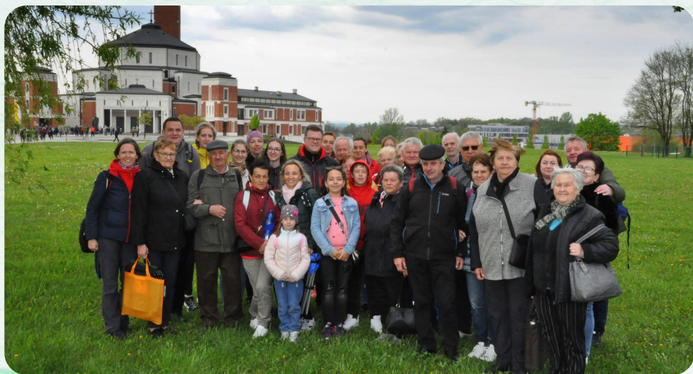
Púť Rádia Lumen v Krakove.