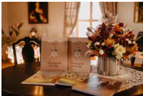
Prezentácia knihy v Paláci Lubomirských