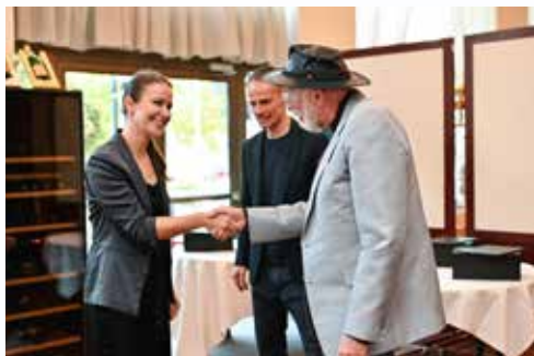
Kip Thorne ďakuje po prevzatí daru dizajnerke