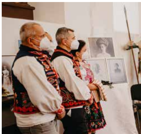
Čestné miesto patrilo obyvateľom Vyšných Ružbách v typickom kroji