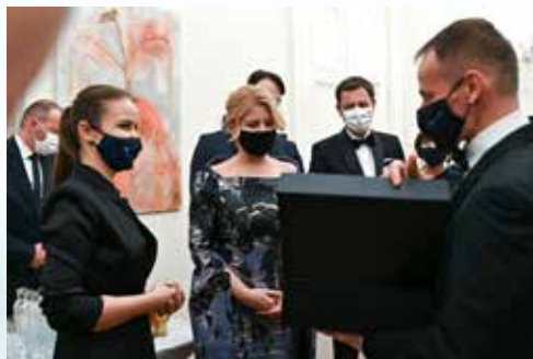
Autorské dielo URANIUM s certifikátom originality dostala do daru aj pani prezidentka a pán premiér