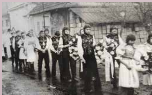
sprievod kňazov, mladých v tradičnom ľudovom kroji na pohrebe