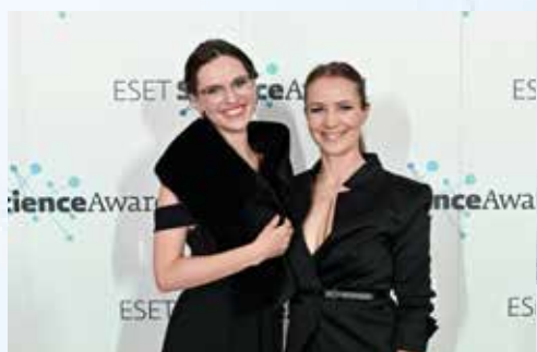
Galavečer ESET Science Award, Bratislava